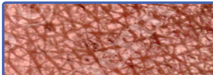
Après 4 séances