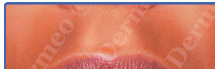
Après 3 séances