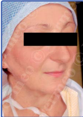
Après 3 séances