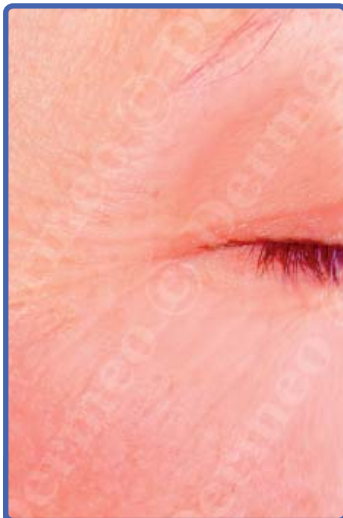
Après 3 séances